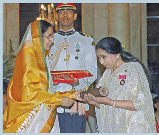
2008లో అప్పటి రాష్ట్రపతి ప్రతిభా పాటిల్ నుంచి పద్మవిభూషణ్ అవార్డు అందుకుంటున్న ఆశాభోంస్లే (స్టైల్)