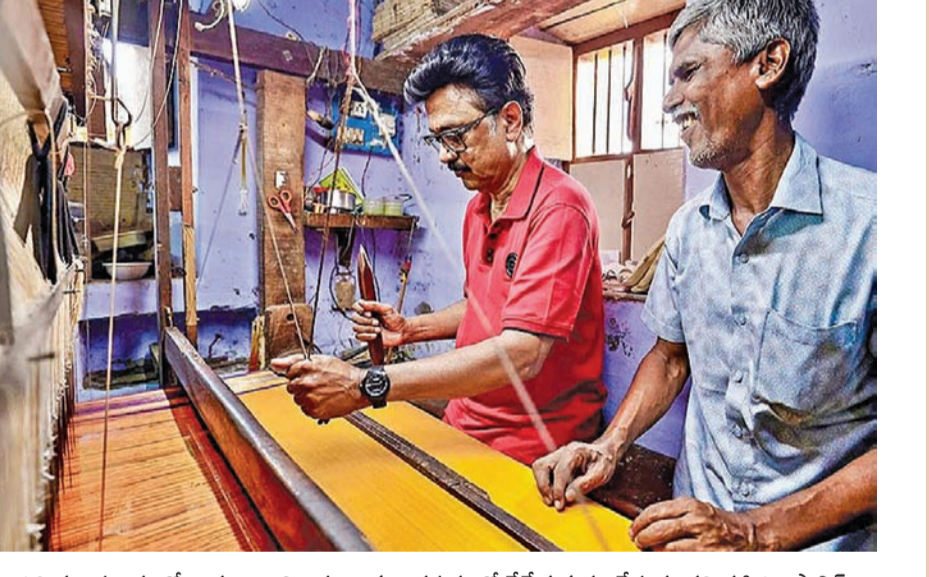
ఎన్నికల ప్రచారంలో భాగంగా ఆదివారం రామనాధపురంలో చేసేత మగ్గం నేస్తున్న తమిళ సీఎం స్టాలిన్